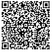
QR Code รายละเอียดโต๊ะหมู่บูชา

รองประธานกรรมการ ปฏิบัติราชการแทน ประธานกรรมการมูลนิธิสถาบันกัลยาณ์ราชนครินทร์